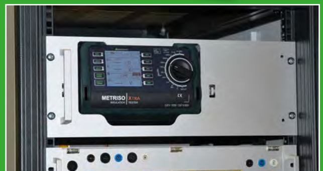
Metriso Serie als 19" Einbauversion