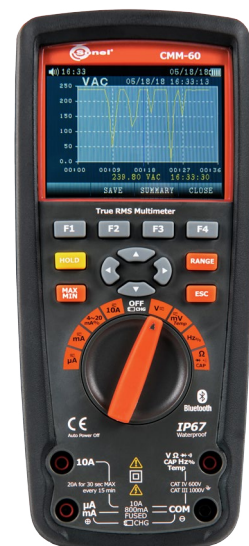
Sone! CMM-60 WMXXCMM60