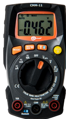
Sone! CMM-11 WMXXCMM11