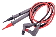
Prüfkabel für CMM (CAT IV, M) WAPRCMM2