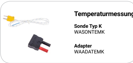
Temperaturmessung Sonde Typ K WASONTEMK Adapter WAADATEMK