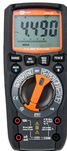
Sone! CMM-30 WMXXCMM30