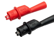
Krokodilklemme Mini, 1 kV 10 A (Set) WAKROKPL10MNI