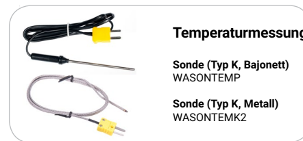
Temperaturmessung Sonde (Typ K, Bajonett) WASONTEMP Sonde (Typ K, Metall) WASONTEMK2