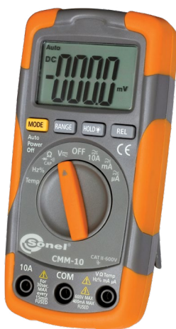
Sone! CMM-10 WMXXCMM10