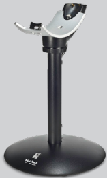
Ladeständer SKU# AC4076-1538