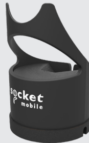
Universales Ladegerät SKU# AC4133-1871