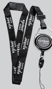
Trageband (schwarz) AC4100-1692